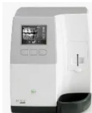
1)Scanner ai fosfori Cs 7600 Carestream usata € 2.200,00 + iva 22%