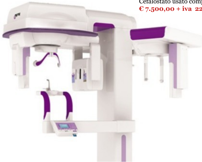
1)Panoramico 2D X7 Myray con Cefalostato usato completo di pc € 7.500,00 + iva 22%