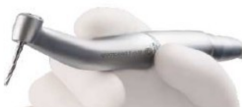
1)Contrangoli Evo SL Stern Weber f.o. anello blu 1:1 Nuovi c.d. €370,00 + iva 22%