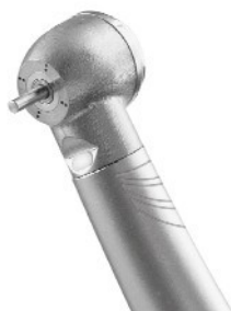
1)Turbine Silent Power Stern Weber f.o. per attacco multiflex Kavo Nuove c.d. €370,00 + iva 22%